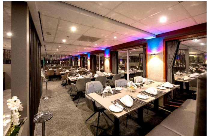
MS Nestroy, Restaurant