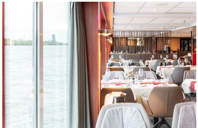
MS Nestroy, Restaurant