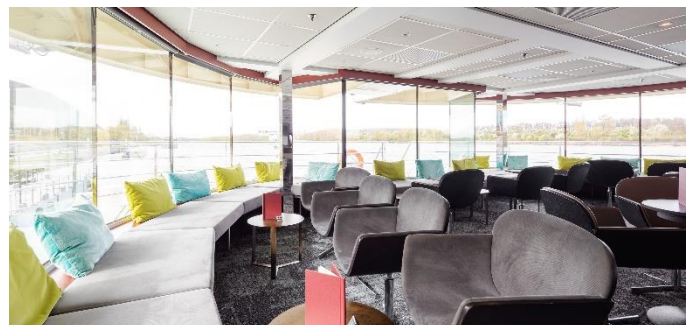
MS Nestroy, Panoramabar