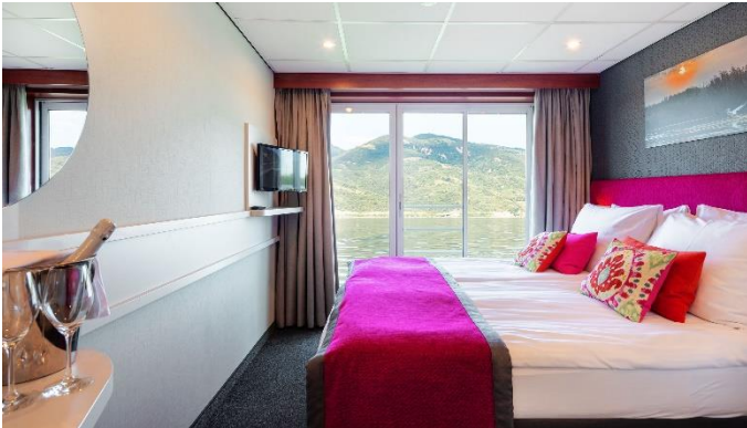
MS Nestroy, Doppelkabine Schiller- / Goethedeck