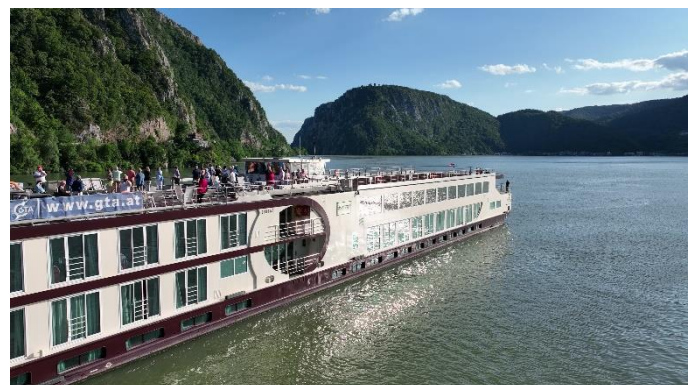
MS Nestroy im Eisemen Tor