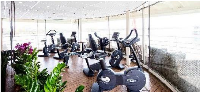
MS Nestroy, Fitnesscenter mit Panoramaaussicht