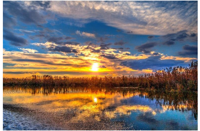
Donaudelta bei Sonnenuntergang

unzählige Kanäle, Nebenflüsse und Seen miteinander verbunden sind. Gemeinsam bilden sie eine über 5.000 km 2 große Flusslandschaft, die weltweit einzigartig ist. Eine natürliche Kulisse aus Wasser, Schilfwäldern, Büschen und Bäumen bietet die Bühne für den Gesang hunderter Vogelarten. Nachdem Bootsausflug gehen wir wiederum an Bord und während des Mittagessens biegt unsere MS Nestroy in den St.Georgs-Arm ab. Der südlichste der drei Donauarme ist ein besonderes Naturschauspiel und deshalb so einzigartig, weil er sich mäanderförmig in das Delta schmiegt. Am Nachmittag erreichen wir schließlich das idyllische Dorf Sankt Georg. Dort bietet sich uns die Gelegenheit zu einem zweiten speziellen Bootsausflug, wo wir mit Schnellbooten zu einer zweiten Delta-Erkundung aufbrechen ( an Bord buchbar ). Ansonsten bietet sich die Gelegenheit, ein wenig am Meeresstrand zu bummeln. Am Abend verlässt die MS Nestroy St.Georg und nimmt Kurs Richtung Ausschiffungshafen.