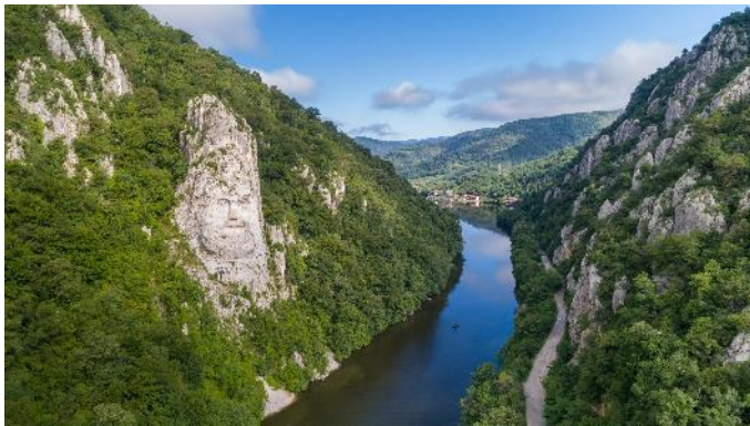
Eisemes Tor mit Decebal

Heute sagen wir der MS Nestroy Lebewohl. In der Früh erfolgt die Ausschiffung und wir treten unsere Heimreise an.