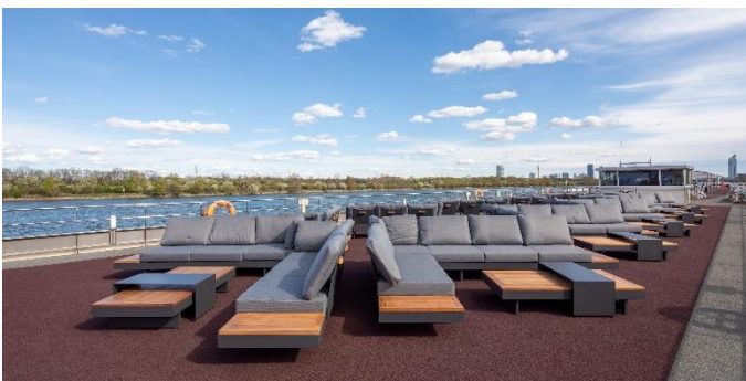
MS Nestroy, Lounge Sonnendeck