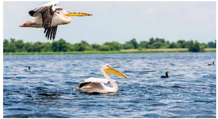
Pelikane im Donaudelta

Es ist nicht immer einfach, ein gutes Angebot als Alleinreisende/r zu finden. Daher bieten wir Ihnen jetzt NEU unser Single Special an: In der Kat. B / Grillparzerdeck nur PLUS € 300 Aufzahlung für eine Kabine zur Alleinbenutzung Limitiertes Kontingent, buchbar solange verfügbar